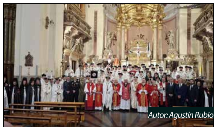
Autor: Agustín Rubio

de anfitrión en una jornada que vuelve a situar a la capital bilbilitana como el corazón espiritual y administrativo de la Orden del Santo Sepulcro en España.