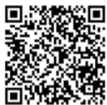
VÍDEO ACTUACIÓN KIKO RIVERA