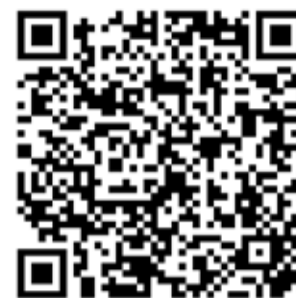
ESCANEA EL CÓDIGO QR PARA VER EL VÍDEO DE LA CELEBRACIÓN DE SANTA MARTA

nosotros", aseguraban los hosteleros participantes. Son ellos los protagonistas de esta jornada y los, generalmente, poco valorados pese a ese reconocimiento y agradecimiento que merecen, pues son uno de los motores importantes en la economía de la capital del Jalón. "Nuestra dedicación y pasión se reflejan en cada plato servido, en cada bebida preparada y en cada sonrisa que ofrecemos a nuestros clientes", subrayaba otro hostelero.