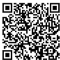
VÍDEO ACTUACIÓN ANA MENA