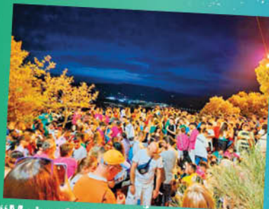
"Mejor fotografía de la Fiesta" David García Pérez